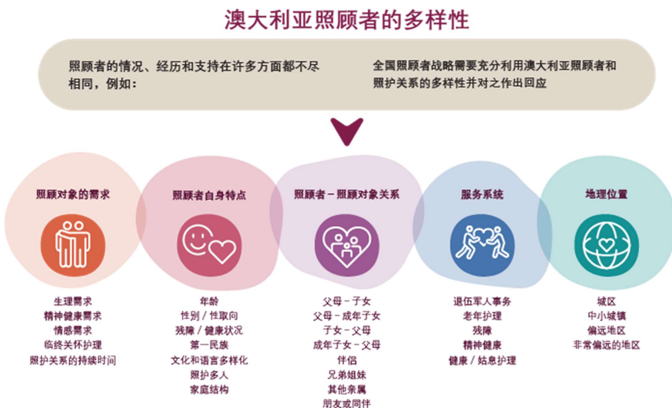
图 1：澳大利亚照顾者的多样性

制定一项新的全国照顾者战略提供了一个机遇，进行全国性的对话，讨论澳大利亚如何支持照顾者。本讨论将探讨照顾者的不同情况，包括照顾者的个人需求、照顾对象的需求、在某些地区可获得支持的程度，以及照顾者如何利用提供这些支持的服务系统。